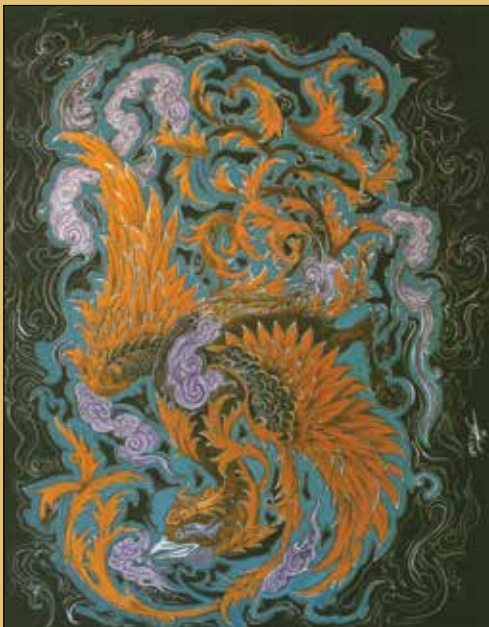
کیانا جوادی بشر / تهران