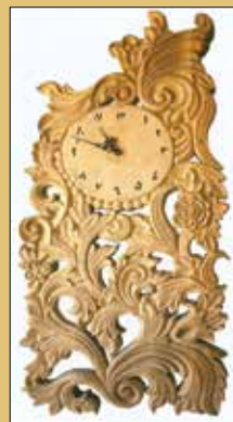
امیر عبدل پور / آذربایجان شرقی