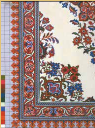
فاطمه سیاح زادگان / فارس