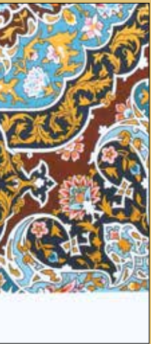
صنایع دستی / مازندران