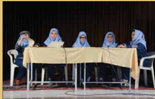
نمایش نامه خوانی