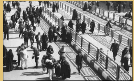
فاطمه مصومی / تهران