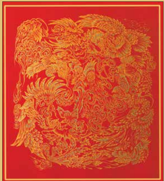
سیده فاطمه خلیفه بهبهانی / شهرستان های تهران