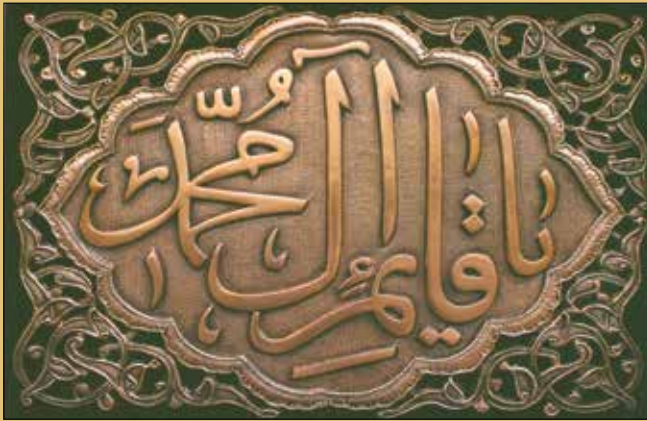
امیر رضایی / اصفهان