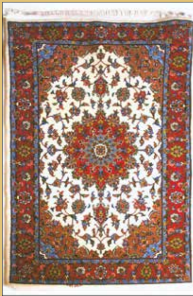
سرایش شریفی / کرمانشاه